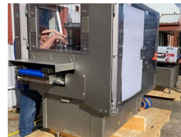
Mit dem Kauf der TCM Alpha compact macht Hames Chocolates einen grossen Sprung nach vorne. Leuchtende Augen bei Ankunft der brandneuen Maschinen.