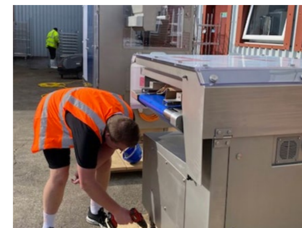
Dieser Neuzugang wird die Produktionskapazität von Hames Chocolates erweitern. Die Mitarbeiter von Carol sind begeistert.