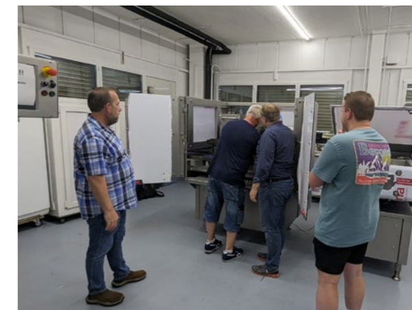
Mitarbeiter von Hames Chocolates besichtigen ihre neue Maschine im R & D Labor von Trikno in Felben. Nicht mehr lange, bis die neue Giessmaschine in die Produktionslinie integriert wird. Die Vorfreude steigt.